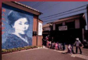
金子みすゞ記念館（長門市仙崎）