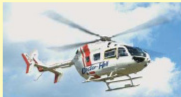
(平成22年度に導入したドクターヘリ)