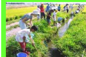
水路の生き物調査