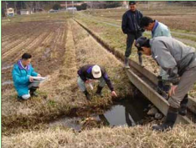
地域の人みんなで資源を点検