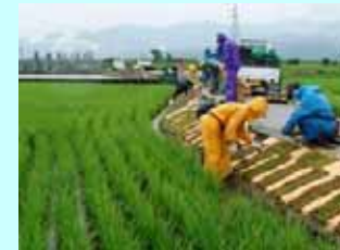
カバープランツ植栽