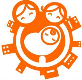
やまぐち子育て応援企業

県では、男女がともに働きながら安心して子どもを育てることができる雇用環境づくりの推進を宣言する事業者を「やまぐち子育て応援企業宣言制度」により応援します。