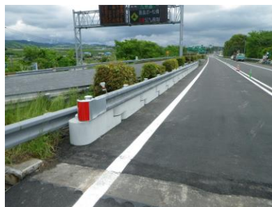
SYエコ・自在R連続ガードレール基礎