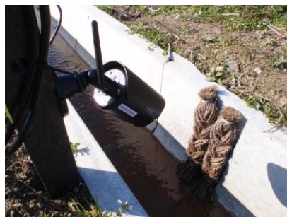
SYエコ・お助けシュロの糸側溝 ケロケロベンチフリューム