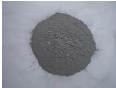
石炭灰(フライアッシュ)