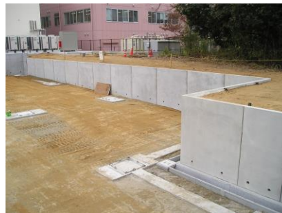
ニューウォルコン