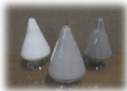
エコソイルロック