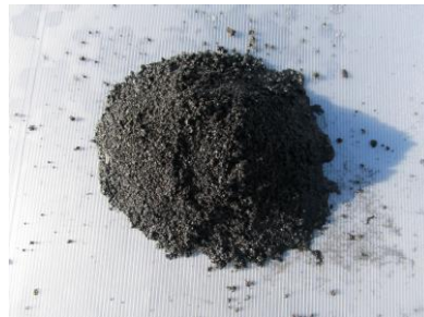
産業廃棄物溶融スラグ