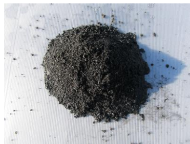
産業廃棄物溶融スラグ