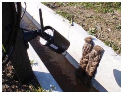
SSエコ・お助けシュロの糸側溝 ケロケロベンチフリューム