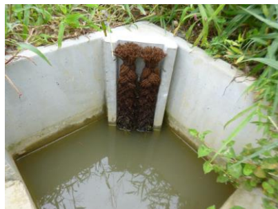
SYエコ・お助けシュロの糸側溝 ケロケロ柵