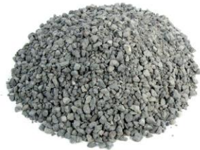
ステンレススラグ