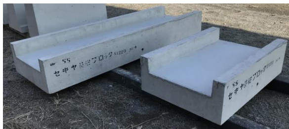
SS・防草型歩車道境界ブロック用基礎ブロック