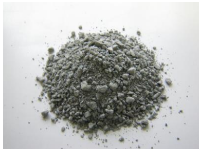
ステンレススラグ