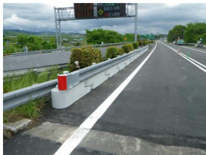
SSエコ・自在R連続ガードレール基礎