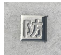
境界ブロック上部へ「防」印