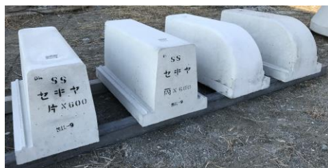
SS・防草型歩車道境界ブロック