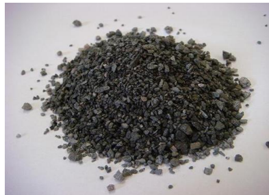
ステンレススラグ含有天然砂代替材