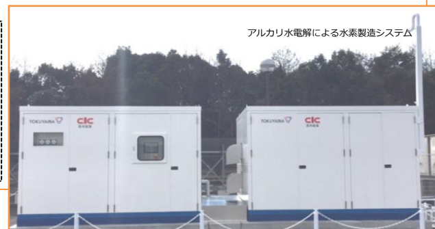
アルカリ水電解による水素製造システム

本セミナーでは、地域に根ざす企業として、これまでに培ってきた水素の安全な取扱い方について、さらに地元企業や自治体等と連携して実施している取組についてご紹介いただきます。