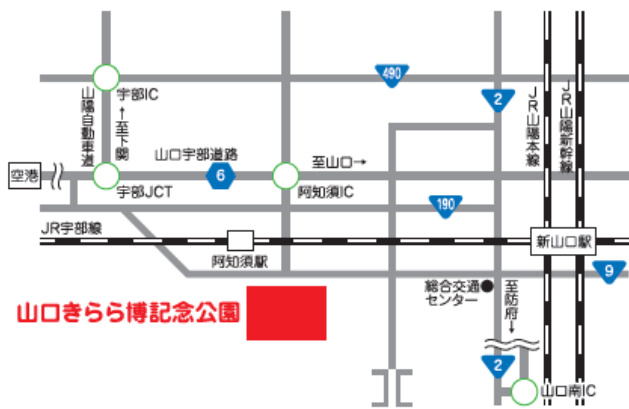
会場アクセスマップ

会場 山口きらら博記念公園 多目的ドーム (山口ゆめ花博会場 / 山口市阿知須509番50)