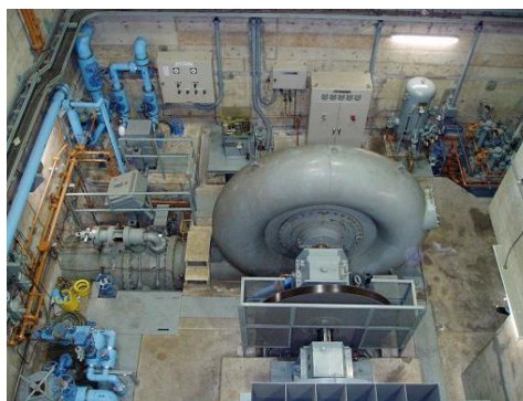
《生見川発電所 水車発電機》