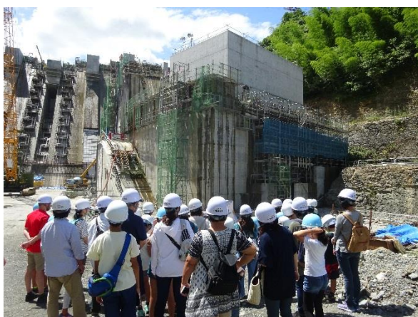
《建設中の平瀬発電所》