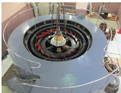
《菅野発電所 水車発電機》