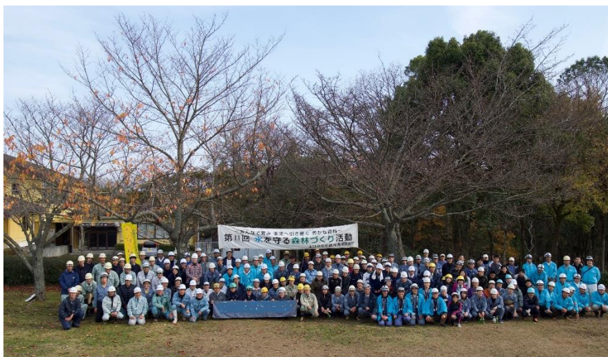
《水を守る森林づくり活動》