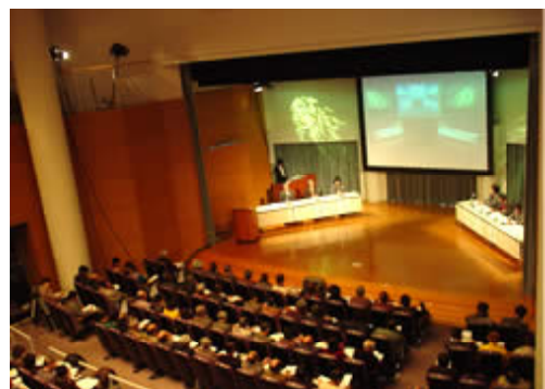
やまぐち森林づくりシンポジウムの開催 (平成17年1月30日)

財源検討委員会の報告を踏まえ、山口県は「やまぐち森林づくり県民税(案)」を公表しました。テレビやラジオ、県のホームページなど各種広報媒体を活用した広報活動、県内10箇所での県民説明会、森林シンポジウムの開催などによる周知を行うとともに、パブリックコメントやシンポジウムの実施時のアンケート調査など幅広い意見の聴取に努め、また、県議会での審議を経て、平成17年4月から平成21年度までの5年間を実施期間として「やまぐち森林づくり県民税」を導入することが決まりました。