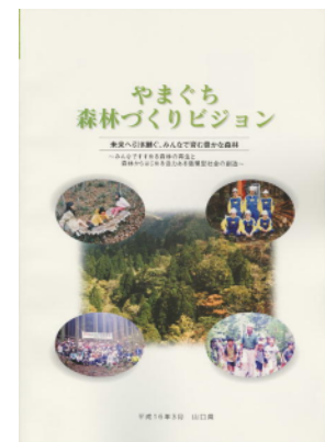
やまぐち森林づくりビジョン (平成16年3月策定)

このビジョンでは、百年先の豊かな森林の創造に向け、人と森林の関わり方を考慮して、本県の民有