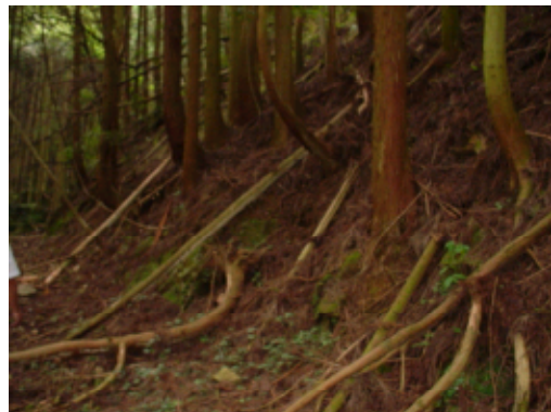
長期間放置され荒廃した森林（下草が枯れ、表土が流出し、樹木の根が露出している。）

近年、農山村の過疎化や高齢化、担い手の減少、また木材価格の長期低迷など林業を取り巻く経営環境の厳しさが増す中で、人工林を中心に荒廃した森林が増加し、水源のかん養や県土の保全など県民生活と密接に関わる森林の多面的な機能の発揮が懸念される状況となっています。この多面的機能の回復を図るため、荒廃した森林の緊急的な整備等を着実に