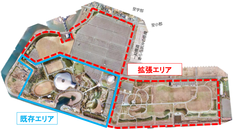
平成16年頃 山口きらら博記念公園付近航空写真