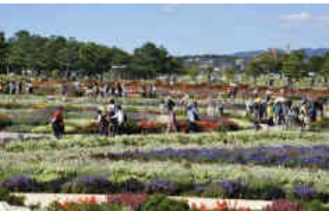
平成30年 第35回全国都市緑化やまぐちフェア(山口ゆめ花博)開催