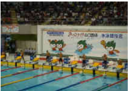
平成23年 第66回おいでませ!