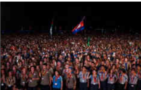
平成27年 世界スカウトジャンボリー