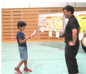
先生やスタッフにも、積極的にアンケートを取りました。