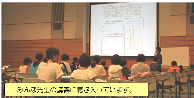
みんな先生の講義に聴き入っています。

中級者以上コースでは、してはいけないグラフのトリックを学び、参加者どうしでお互いにアンケートを取った結果を統計グラフにし、一枚の画用紙にまとめる練習をしました。