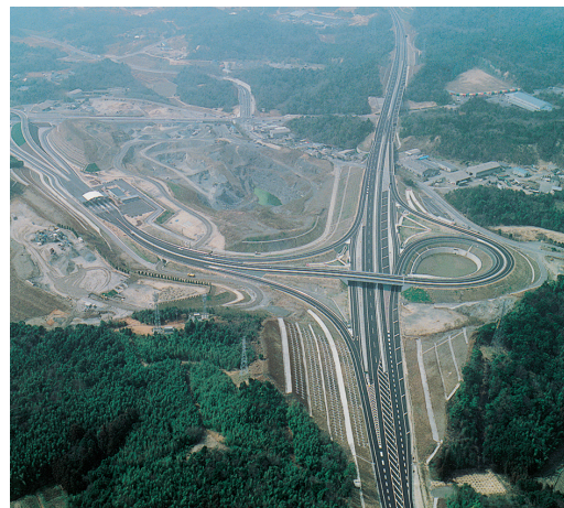
山陽自動車道宇部下関線 宇部IC

機構法: 独立行政法人日本高速道路保有・債務返済機構法 会社法: 高速道路株式会社法 特措法: 道路整備特別措置法