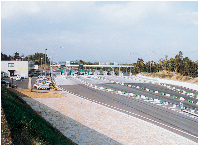
山口宇部有料道路