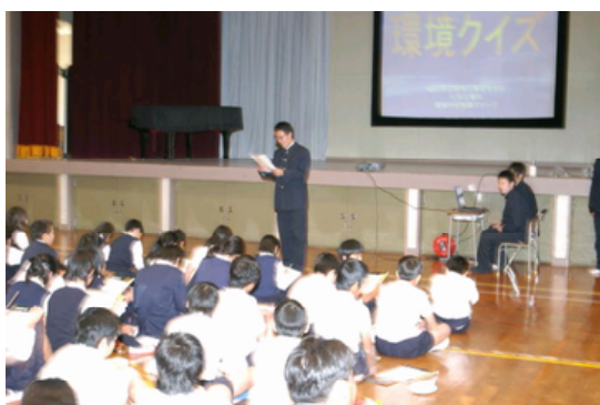
小学生との交流（環境クイズ）