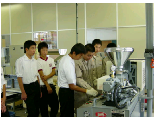
体験入学における中学生の指導

小学校を訪問し、「環境クイズ」により、小学生と交流し、地球環境の大切さを教えます。