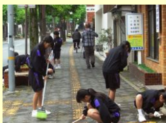
山口駅通りの清掃