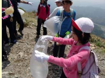
十種ヶ峰登山ごみ拾い