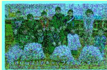
キャップ回収の成果