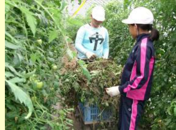
ふれあいファーム