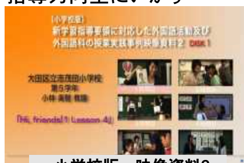
小学校版 映像資料2

※前回の映像資料では、ALTとのTTの在り方や教室英語の使い方等テーマに沿った 1時間毎の授業 が紹介されていましたが、今回は 1単元の流れ に視点をあてて作成されています。