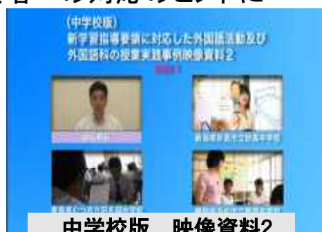
中学校版 映像資料2

※前回の映像資料では、 学習指導要領改訂の趣旨に照らし、基本的な授業の進め方 の参考となるよう、言語活動に焦点をあてた授業が紹介されていましたが、今回は改訂の大きなポイントである「 授業時数増 」への 具体的な対応の在り方 という視点を中心に構成されています。