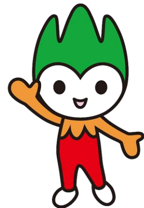
山口県PR本部長 「ちよるる」