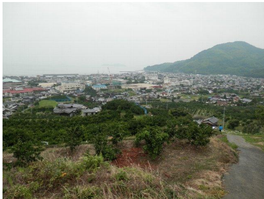
避難場所から学校を望む