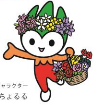
サポートキャラクター ちよるる