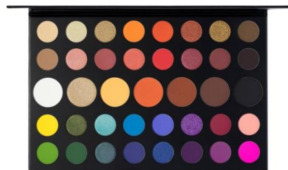
Figure 2 アイシャドーパレット

て、アメリカ、特に彼が活動しているカリフォルニア州では LGBT の方々に対する理解があり、彼の成功はそれを物語って