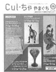
情報発信「Culーちゃ やまぐち」