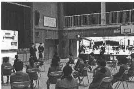
5Gによる遠隔授業「5Gアートスクール」