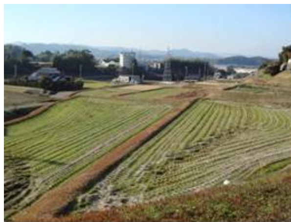
【協定農用地の景観】