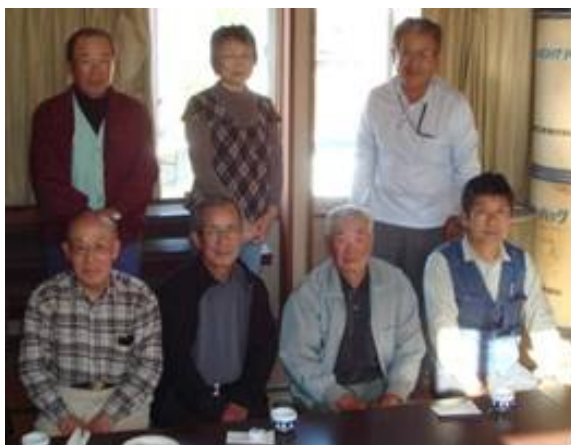
【三反田集落協定の方々】

農地・水・環境保全向上対策「地方下集落環境保全会」では、河川の草刈り等の管理を年2回行っている。河川をきれいに管理した結果、ホタルやオニヤンマ（大型のトンボ）も多く出るようになり、集落環境が向上している。