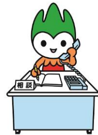
山口県PR本部長ちよるる

賃金、労働時間、退職、解雇、パワハラなど、労働問題に関するご相談に、専門の社会保険労務士がお応えします。