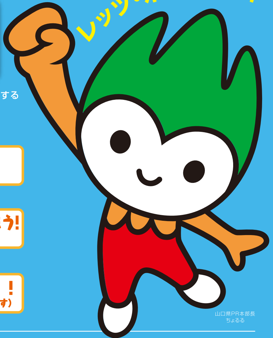
山口県PR本部長 ちよるる