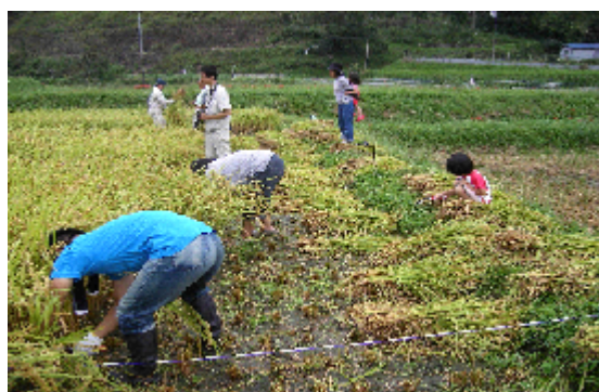
水田オーナー制度（稲刈風景）

平成 20 年度からはさらに、隣接の上政集落も加わり、合計 3 集落の連携に発展し、9 家族が参加するようになった。