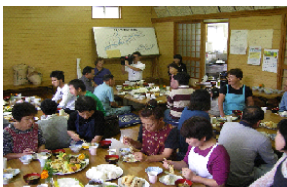
水田オーナー制度（収穫感謝祭）