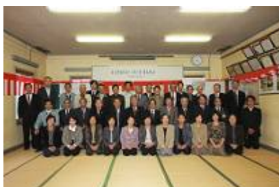
【農業法人七見の里の設立】

また、農閑期には集落の女性が中心になり、農地・農道等の法面への景観形成作物の作付けなど環境を意識した取組を進めていく。