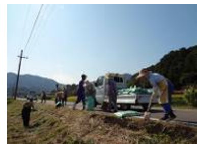
【集落の女性を中心とした景観整備作業】