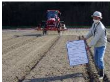
【共同機械購入した乗用管理機】