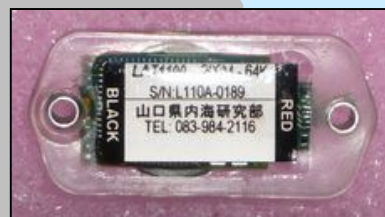
アーカイバルタグ(幅3cm)