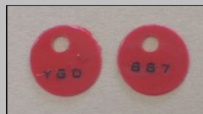
アトキンス型タグ(直径1cm)