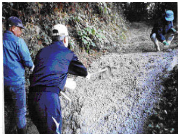
農道補修作業風景

猪等による農作物の被害を防止するため新設箇所及び共同機械利用箇所並びに耕作放棄防止の為の耕畜連携箇所をマップで示すことで、集落の誰が見てもわかり、進捗状況も確認出来るマップとなっている。