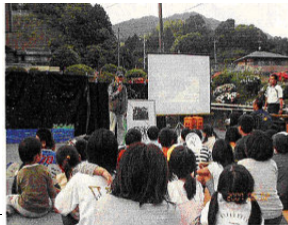
地元小学校・PTA主催ほたるの夕べ