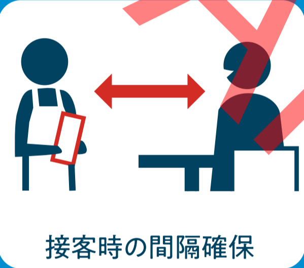
接客時の間隔確保