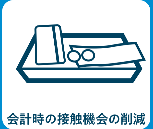
会計時の接触機会の削減