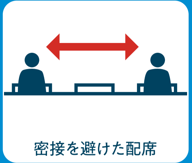
密接を避けた配席