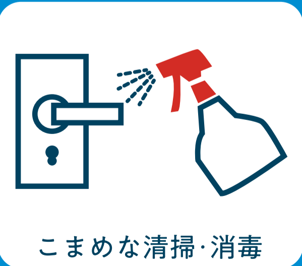
こまめな清掃・消毒