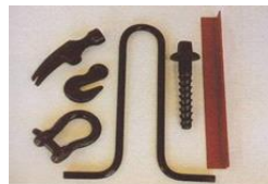
加工製品 (カラーアングル、吊筋等)