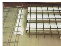
加工製品 (バーメッシュ)