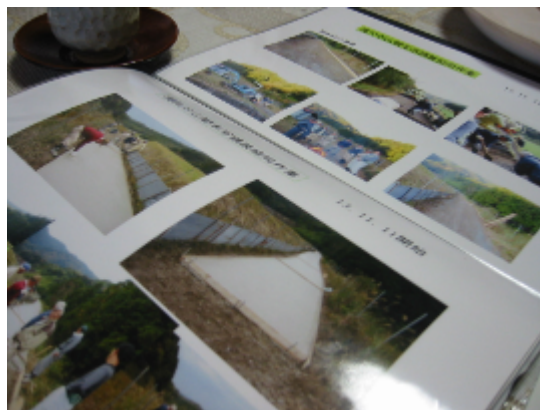
(活動写真がいっぱい)

- 「圃場整備はしていましたが、ため池や水路の改修、農道舗装など、まだまだやることが多くありました。経費的な問題から思うようにできなかった事業を、協定でやることにしたんです。」