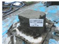
NSSショットクリート