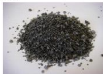
ステンレススラグ