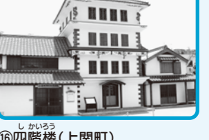
⑯四階楼(上関町) 上関町教育委員会 ☎0820(62)0069