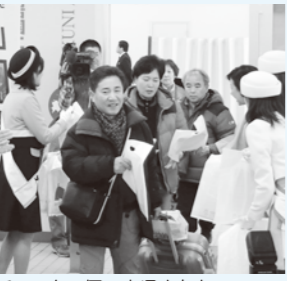
チャーター便で来県された外国人観光客(昨年の様子)

お問い合わせ先 県観光振興課 ☎083(933)3160 県交通政策課 ☎083(933)2522