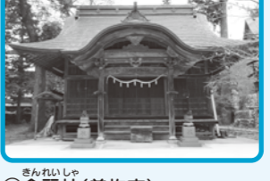
⑪金麗社(美祢市) 美祢市教育委員会文化財保護課 ☎0837(53)0189