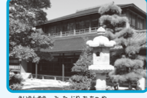
⑤英雲荘(三田尻御茶屋)(防府市) 英雲荘 ☎0835(23)7276