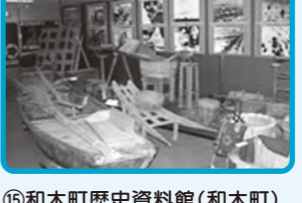
⑮和木町歴史資料館(和木町) 和木町教育委員会 ☎0827(53)3123