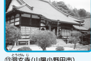
⑬洞玄寺(山陽小野田市) 山陽小野田市観光課 ☎0836(82)1151