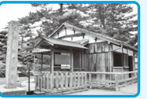
④松下村塾(萩市) 松陰神社 ☎0838(22)4643