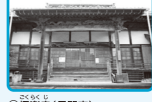
⑨極楽寺(長門市) 長門市観光課 ☎0837(23)1137