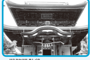
⑥花岡八幡宮(下松市) 下松市産業観光課 ☎0833(45)1841