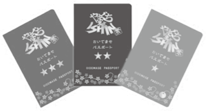
全県周遊型パスポートブック ※イメージ

お問い合わせ先 やまぐち幕末ISHIN祭プロジェクト推進委員会事務局 県観光振興課 ☎083(933)3170 一般社団法人山口県観光連盟 ☎083(924)0462