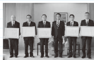
昨年12月9日に行われた協賛金融機関への感謝状贈呈の様子の様子

*株式会社商工組合中央金庫、中国労働金庫、東山口信用金庫、株式会社西京銀行、株式会社山口銀行 労働政策課 ☎083(933)3221