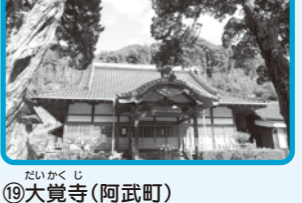
⑲大覚寺(阿武町) 阿武町経済課 ☎08388(2)3114