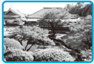
②宗麟寺(宇部市) 宇部市観光・6次産業推進課 ☎0836(34)8353