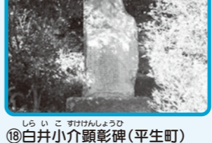
⑱白井小介顕彰碑(平生町) 平生町経済課 ☎0820(56)7117