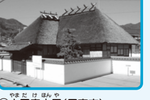
⑫山田家本屋(周南市) 周南市観光交流課 ☎0834(22)8372