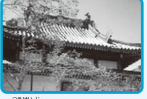
⑦通化寺(岩国市) 岩国市教育委員会周東支所 ☎0827(84)7707