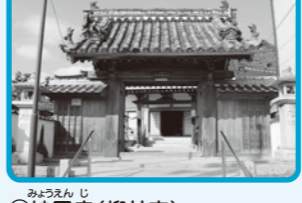
⑩妙円寺(柳井市) 柳井市大畠出張所 ☎0820(45)2211