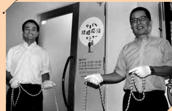
除幕する村岡知事