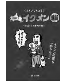
お父さんの育児手帳

育児を積極的に行う男性「イクメン」を応援するため、父親向けに子育てに役立つ情報を盛り込んだ「お父さんの育児手帳」を配布するほか、「イクメンセミナー」を県内3カ所で開催します。