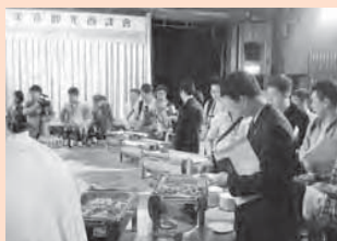
ぶちうまやまぐち総合フェアin台湾

県産農林水産物の輸出拡大と海外からの観光客誘致を図るため、9月11日・12日の2日間、台北・台中・高雄において「台湾縦断キャラバン」を実施しました。