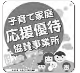
協賛事業所ステッカー

利用方法やサービス内容など、詳しくは「やまぐち子育て家庭応援」のホームページをご覧ください。協賛事業所は、ステッカーが目印です。