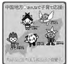
中国地方連携ステッカー