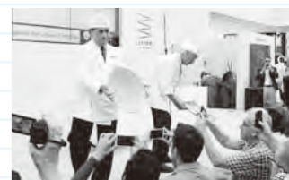
ふぐの盛り付け実演の様子

また、別会場の日本食材専門店でも、輸出拡大等の海外展開を目指した「展示・商談会」を開催し、本県の食品などをアピールしました。