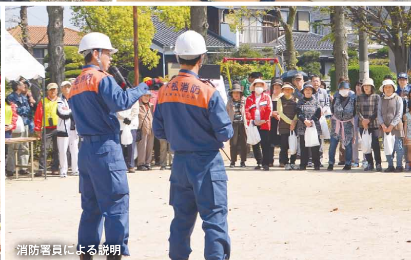
消防署員による説明