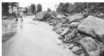
平成21年に発生した土砂災害(防府市下右田)

土砂災害から身を守るためには、一人一人が正しい知識を持ち、いつも最新の防災情報を入力して、いざというときに素早く避難できる ように備えておくことが大切です。