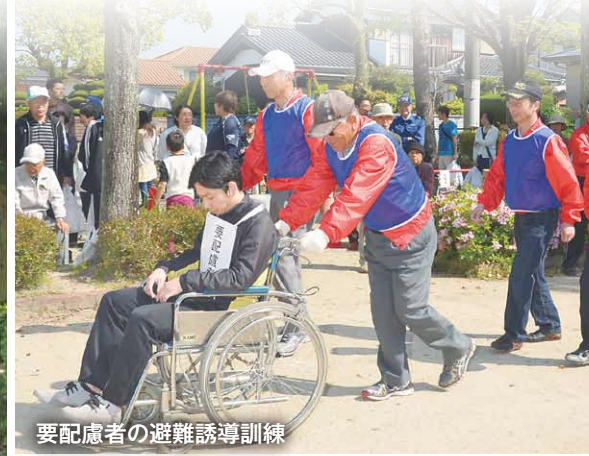
要配慮者の避難誘導訓練