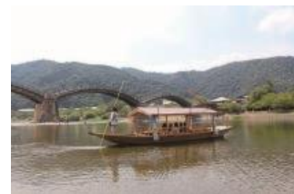
秋の錦帯橋地酒舟

【お問合せ】岩国市観光協会 鶴飼事務所 0827-28-2877 ※3日前までに要予約