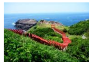
絶景バスイメージ (元乃隅稻成神社)