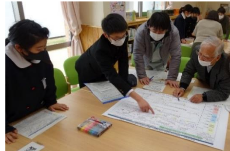
児童生徒参画による学校・地域連携カリキュラム検討会議