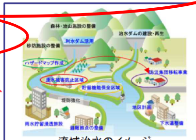
流域治水のイメージ

▶【目標・効果】気候変動による降雨量の増加に対応した流域治水の実現 (KPI) ○浸水想定区域を設定する河川数:2,092河川(2020年度)⇒約17,000河川(2025年度)