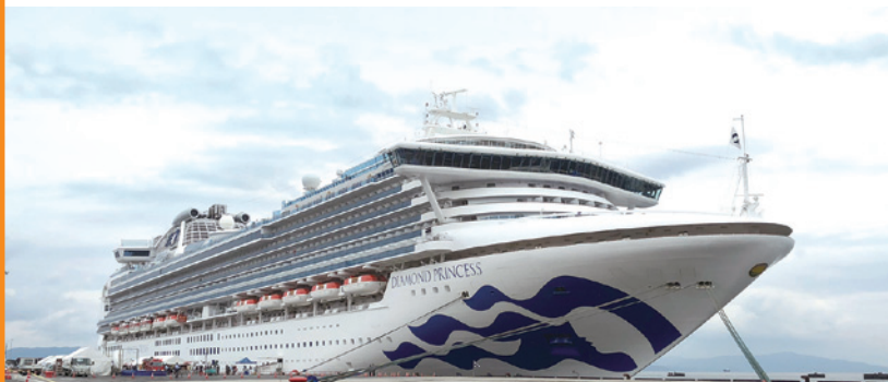
ダイヤモンド・プリンセス 初寄港 (H30.10岩国港)